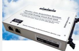
FEU (フロントエンドユニット)